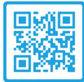
Scan de QR-code voor de folder Vertegenwoordiging

Ook wij helpen u graag op weg. Met vragen kunt u terecht bij Maatschappelijk Werk Intramuraal van MeanderGroep. U kunt tijdens kantooruren contact opnemen via het secretariaat: T 045 456 78 40. Een van de maatschappelijk werkers neemt daarna contact met u op.