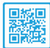
Folder Ontevreden of klachten?