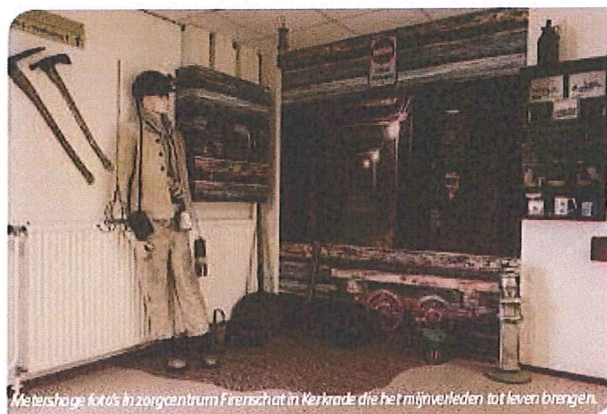
Meerstoupe foto's in zorgcentrum Firenschat in Kerkrade die het mijnelleden tot leven brengen.

Samen koken en eten belangrijke ankerpunten