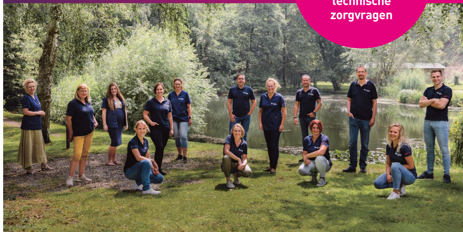
● Het Highcare Team anno 2021

24 uur per dag beschikbaar voor de meest uiteenlopende (semi-)acute en technische zorgvragen