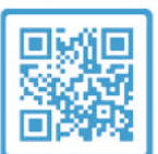
Folder Ontevreden of klachten?