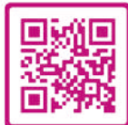
Folder Wet zorg en dwang