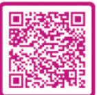
Folder Ontevreden of klachten?