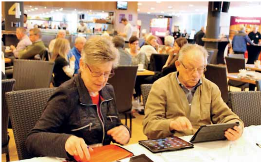
Op de foto: cursisten van de iPad training demonstreren hun vaardigheden tijdens de Parkstad Zorgbeurs op 17 oktober jl. in het Parkstad Limburg Stadion in Kerkrade.