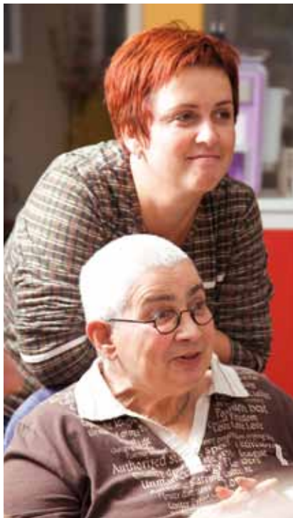
De personen op bovenstaande foto zijn niet de personen uit het interview, maar een bewoner en medewerkster uit de woongroep voor jong dementerenden.

“Toen ik wist wat er aan de hand was, kon ik haar gedrag en verschillende gebeurtenissen plotseling veel beter begrijpen”