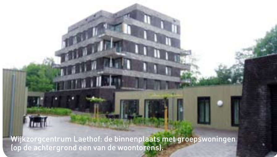
Wijkzorgcentrum Laethof: de binnenplaats met groepswooningen (op de achtergrond een van de woontorens).