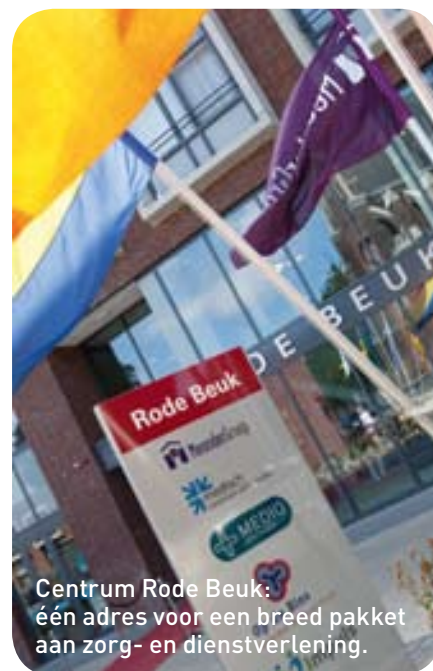
Centrum Rode Beuk: één adres voor een breed pakket aan zorg- en dienstverlening.

De 'Rode Beuk' omvat ook 40 appartementen die ook geschikt zijn als zorgwoningen omdat zij dicht bij de zorgaanbieder liggen.