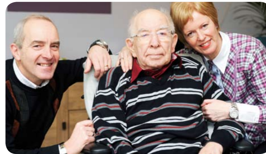
De familie Hetebrij

In 2011 worden ze wettelijk verboden: onrust (of Zweedse) banden waarmee bewoners van verpleeghuizen soms worden vastgebonden. Verpleeghuis Lückerheide in Kerkrade heeft al in 2007 vrijwel alle vormen van vrijheidsbeperking afgeschaft. Het verpleeghuis vervult een voortrekkersrol.